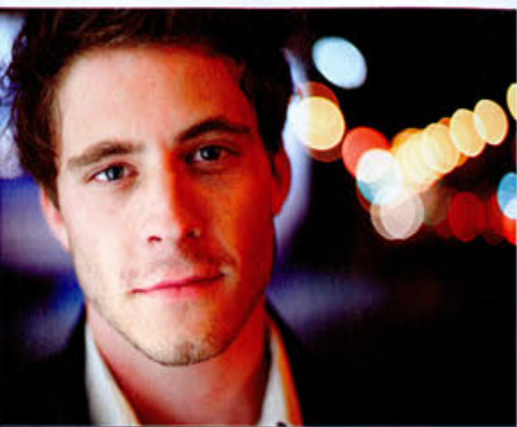
Lumière naturelle « Ce portrait a été réalisé lors d'une sortie de repérage. Le modèle est éclairé par un panneau publicitaire. La photo a été prise au 50 mm f/1,6 sans flash à 1/100. »