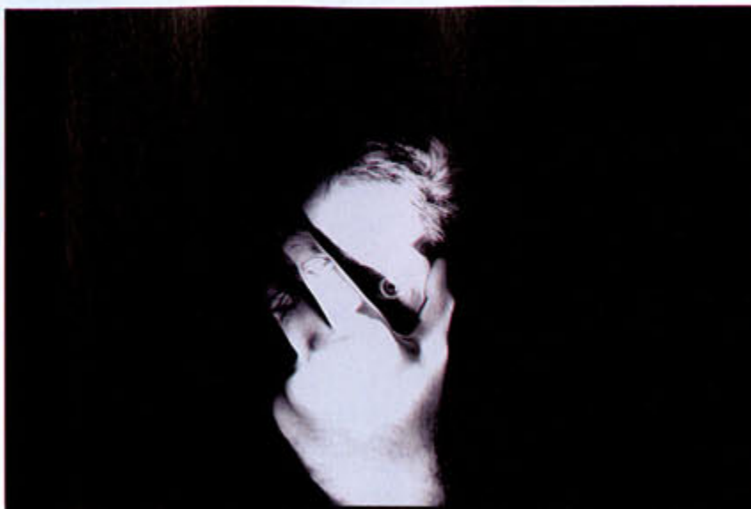
Autodestruction « Cette photo est un parfait accident de prise de vue. À l'origine, j'essayais de réaliser de longues expositions de 10 à 15 secondes pour faire ressortir mon visage de l'obscurité à l'aide de petites lampes torches mobiles. Une erreur dans le mode de prise de vue, et j'ai obtenu cette image surexposée, qui reste un de mes autoportraits favoris. »